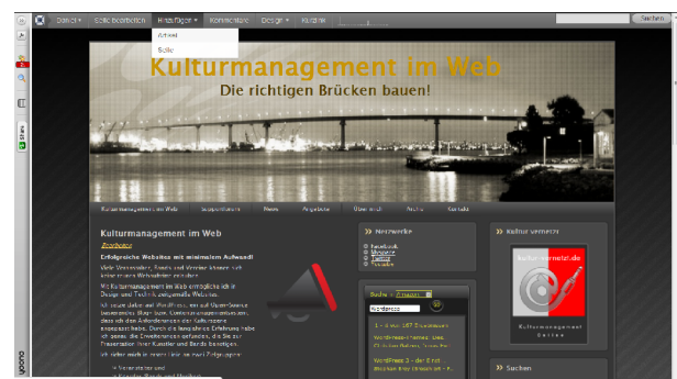
Die neue Adminbar am oberen Bildschirmrand

Nur auf den aktuellsten Versionen einer Software werden Updates für die verwendeten Plugins angeboten.